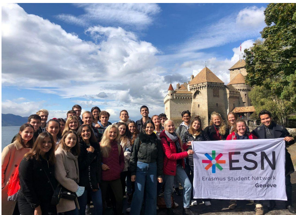
Erasmus Student Network (ESN) – у Шильонского замка, Монтрё

Для студентов, приехавших по обмену, студенческая организация ESN (Erasmus Student Network) организывает знакомства с университетским кампусом, городом и особенностями жизни в Швейцарии, викторины и квесты, кулинарные вечера и велопрогулки – каждый сможет найти интересного собеседника и узнать много нового о стране!