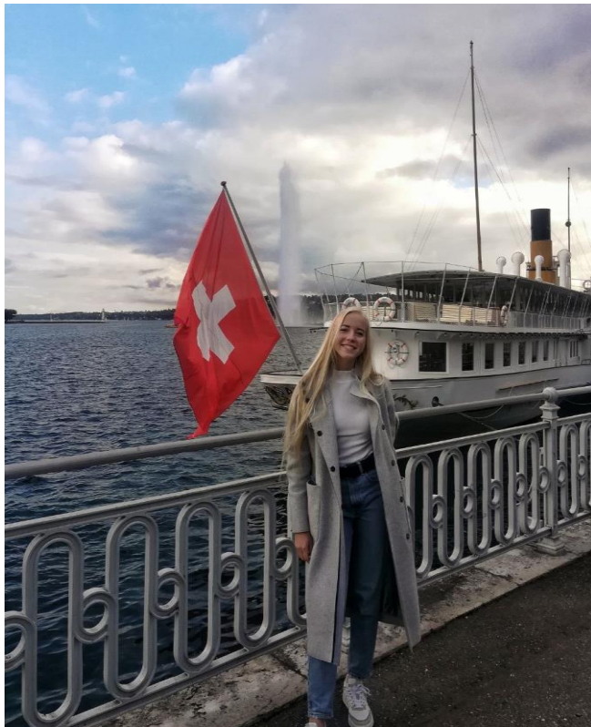
Jet d'Eau – самый высокий фонтан Европы, 147 м