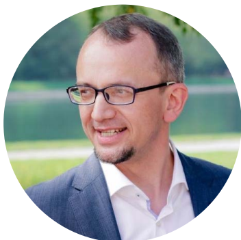
Александр Архангельский, культуролог, искусствовед