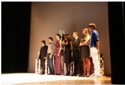
Второй выпуск в «Женевском отделении»

Пятого ноября 2009 г. в зале Cité Bleue в Женеве состоялась торжественная церемония вручения дипломов МЦЛ уже второму выпуску университета. Вела вечер актриса Вахтанговского театра и кино Л. Л. Вележева. Новосовершенные магистров, специалистов, бакалавров Юридического и Географического факультетов приехали поздравить их деканы, ректор МЦЛ, а также собраты из Швейцарского актерского училища. Пеани, стихи и танцы подготовили в подарок выпускникам их университетские товарищи. Самым ярким сюрпризом, конечно, было появление на швейцарской земле В. А. Этуша — его проникновенные стихи согрели присутствующих своим сердечным теплом в этот дождливый осенний женеvский вечер.